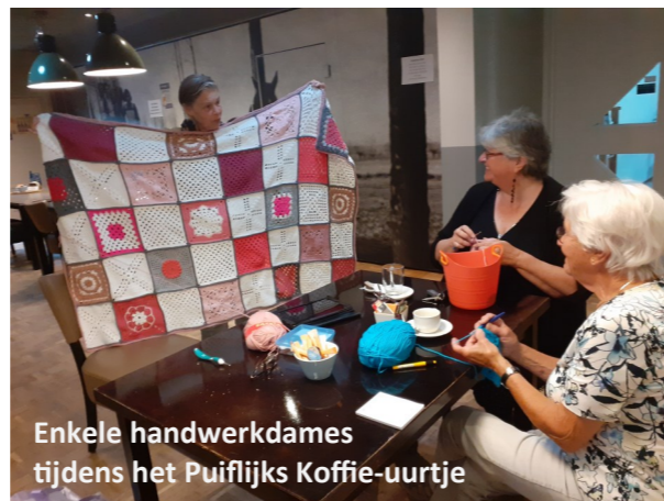
Enkele handwerkdames tijdens het Puiflijks Koffie-uurtje

Houd U Fit! Om 9.00 uur in de sportzaal De Lier