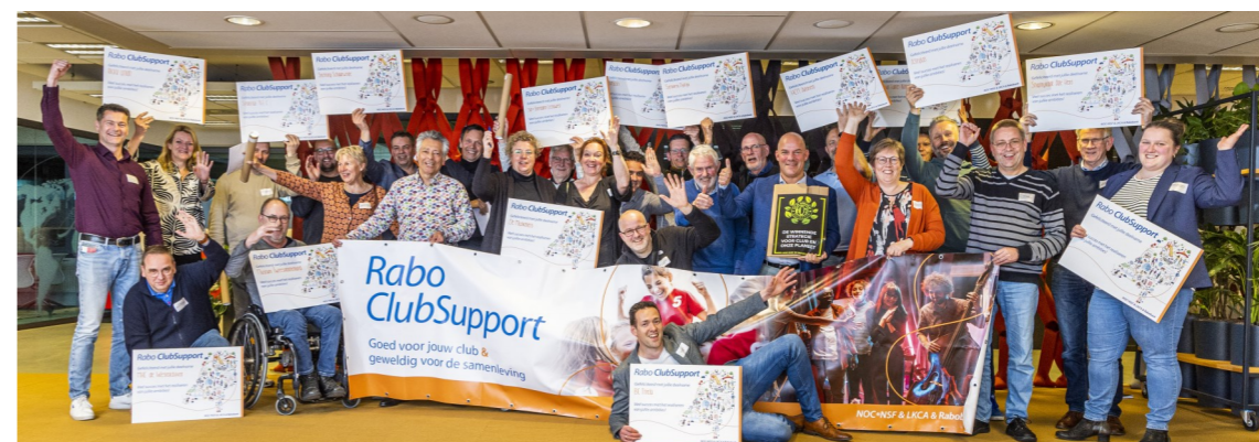
Foto van de Kick-Off bijeenkomst van Rabo ClubSupport in Elst. In het midden wordt Puiflijk door de voorzitter en secretaris vertegenwoordigd

Laat van u horen! info@seniorenpuiflijk.nl tel. 0487-51 42 32